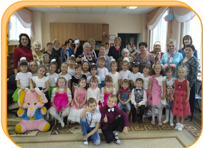
Детский сад «Сказка» п. Красный ключ