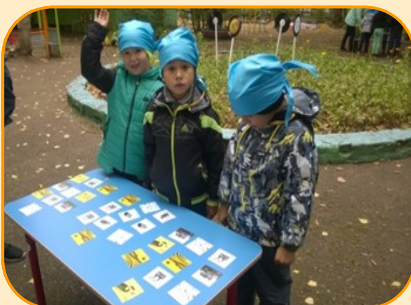
Станция «Экологическое телогу»