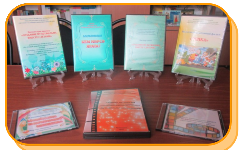
Авторы: Харитонова О. И., 82 нче балалар бакчасы татар һәм рус теле тәрбиячесе

Тел кешеләргә аңлашу-аралашу өчен кирәк. Шунан итә тотыйк: балаларның тел үзләштерүе һәм аны актив куллануы, тәрбия һәм белем алуының һәрвакыт үсеш өчен уңайлы шарт булып тора.