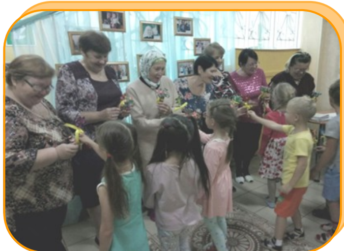
Детский сад № 87