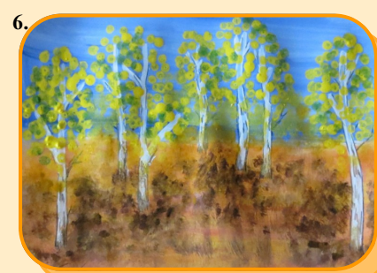
Осень (М. Геллер)

Дарит осень чудеса, Да еще какие! Разнаряжены леса В шапки золотые. На пеньке сидят гурьбой Рыжие опята, И паук – ловкач какой! – Тянет сеть куда-то. Дождь и жухлая трава В сонной чаще ночью Непонятные слова До утра бормочут.